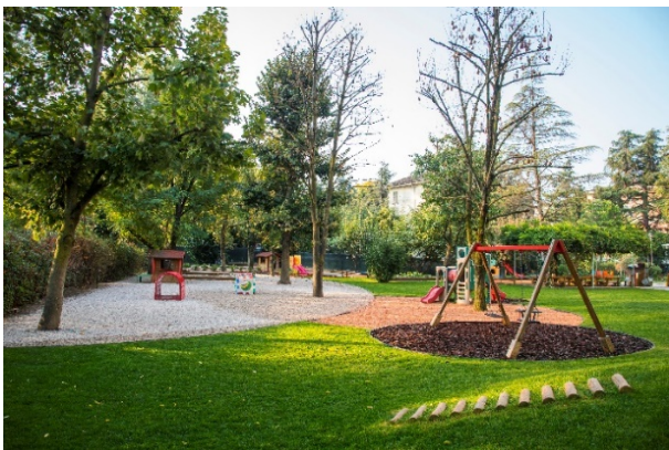
Il Pink Panther